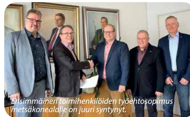
Ensimmäinen toimihenkilöiden työehtosopimus metsäkonealalle on juuri syntynyt.

Rakennusliiton kanssa sovimme helmikuussa maarakennusalan palkat vuodelle 2023 ja elokuussa maarakennusalan työehtosopimuksen jatkamisesta vuodelle helmikuun 2025 loppuun. Lisäksi sovimme marraskuussa kaikkien maarakennusalan kulkemiskorvausten muutoksista seuraavalle vuodelle.