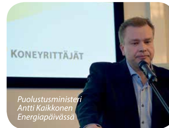
Puolustusministeri Antti Kaikkonen Energiapäivässä

Uudistimme jäsenille tarkoitettun PEFC-metsäsertifiointivaatimusten tarkistuslistan vastaamaan uuden standardin kriteerejä.