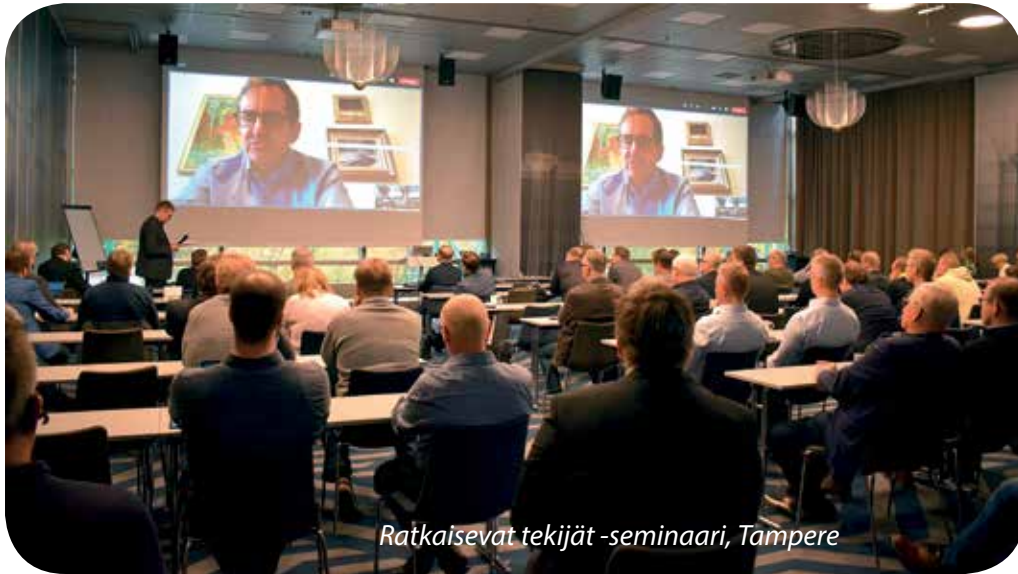
Ratkaisevat tekijät -seminaari, Tampere

Koneyrittäjien Datapankki -ohjelmaan kehitettiin kannustavan palkkauksen vaatimia ominaisuuksia.