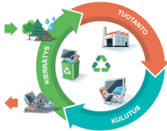
HANKINNAT JA ELINKAARIAJATTELU