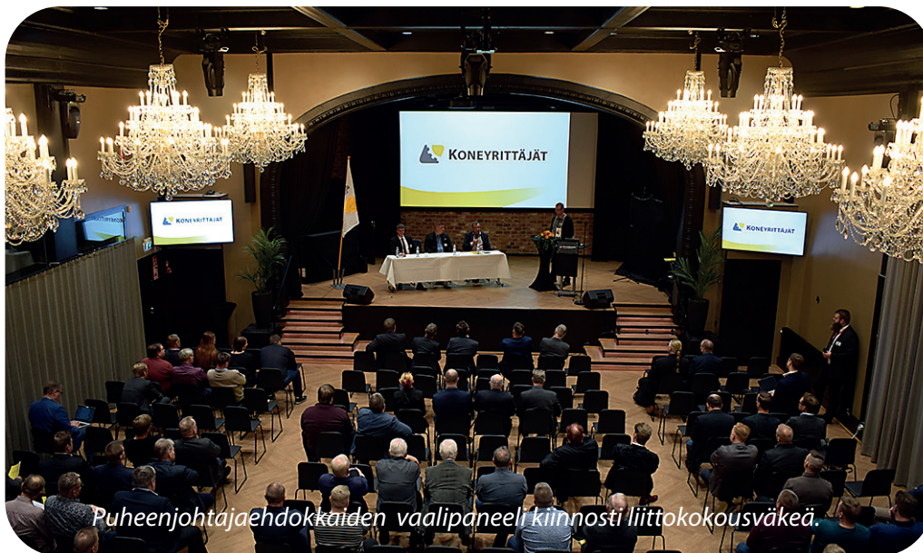
Puheenjohtajaehdokkaiden vaalipaneeli kiinnosti liittokokousväkeä.